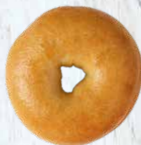
Øko Mini Bagel Plain Varenummer: 464155 4-pak varenr: 464154

En lækker lille mundfuld, som man godt kan spise et par stykker af.