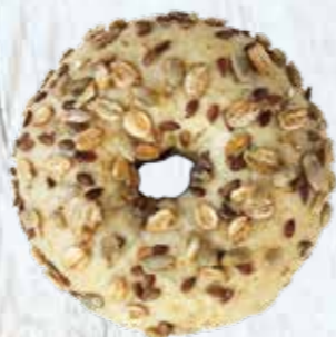
Øko Mini Bagel Grov Varenummer: 465155 4-pak varenr: 465154