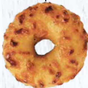
Øko Mini Bagel Chili/Cheddar Varenummer: 464555 4-pak varenr: 464554